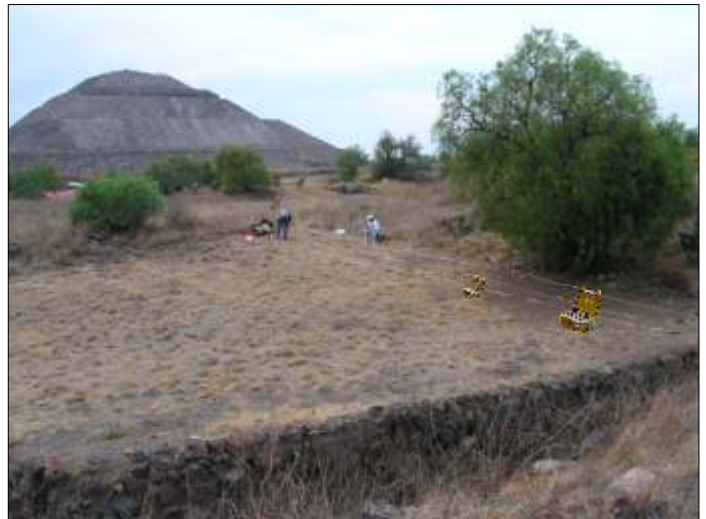
per gentile concessione prof. P. Mauriello (Univ. del Molise)