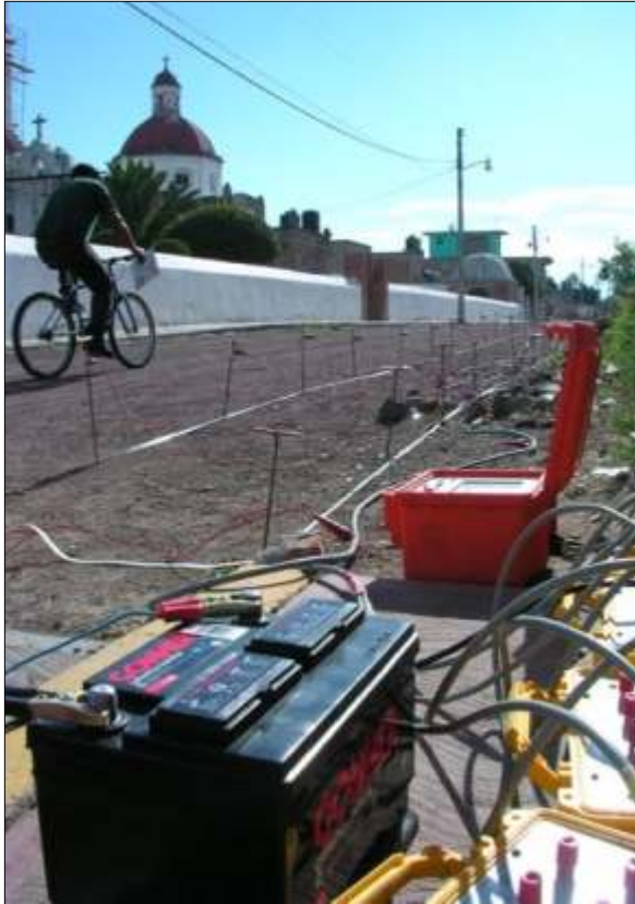
A3000/E prospezioni multi-elettrodo eseguite in Marocco