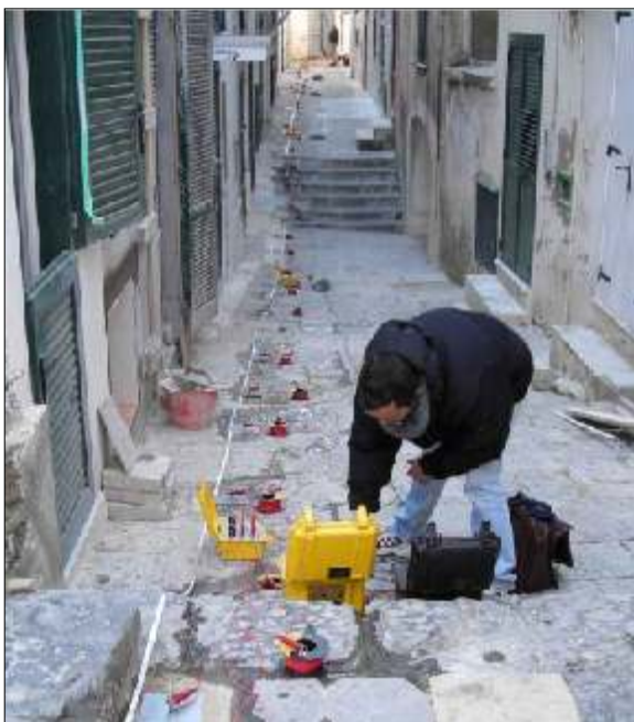
A3000/E prospezione multi-elettrodo Isola di Ponza