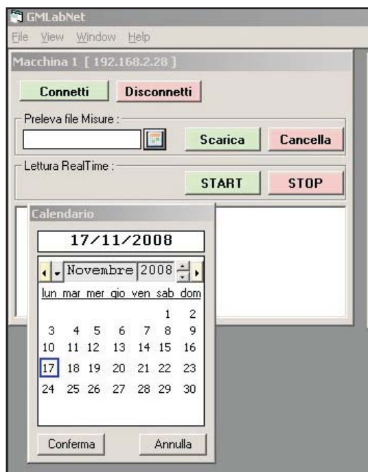
finestra di ricerca

L'applicazione consente di gestire la connessione tramite rete LAN con tutte le unità remote, è possibile visualizzare lo stato dei sensori collegati alle unità remote, anche simultaneamente, nonché effettuare l'archiviazione dei dati acquisiti.