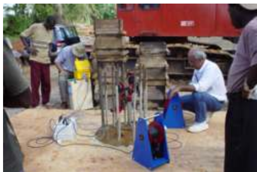
posizionamento bobine portasonde ed encoder