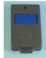
Telecomando per pulsante di soccorso

Il Telesoccorso M.A.E. è costituito da un computer centrale con apposito software, installato presso i Centri Acquisizione Dati di Enti o Strutture private, preposti alla gestione dei servizi, ed a centraline intelligenti da installare presso gli utenti.