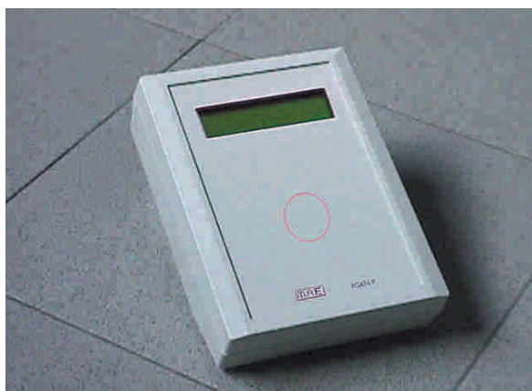
Letttore uso Ufficio