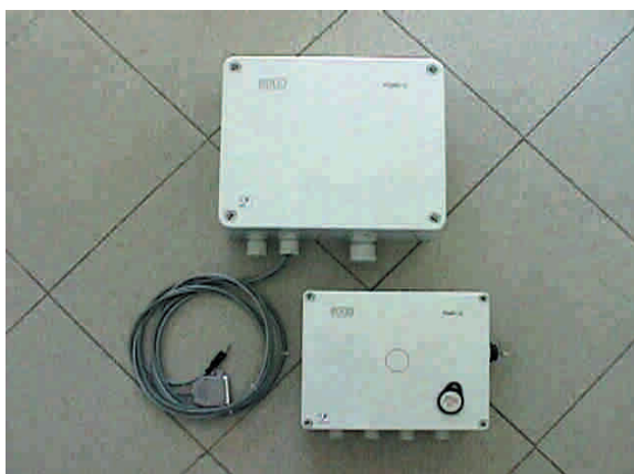
Centralina per gestione sistema e lettore per distributori