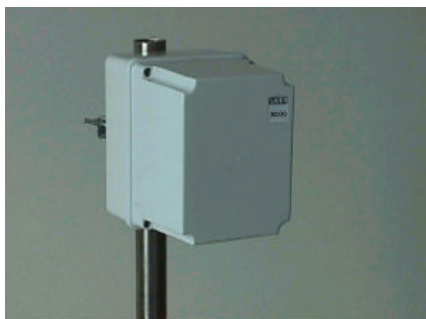
versione da palo